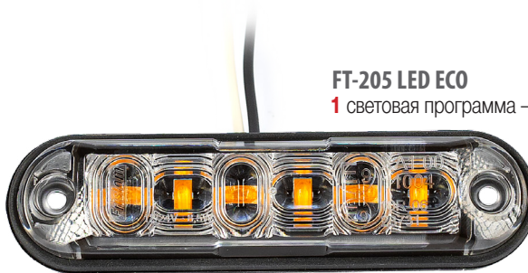
FT-205 LED ECO